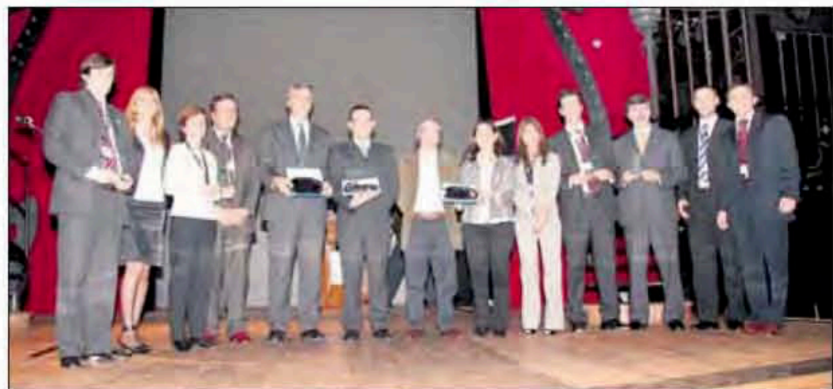
Representantes de las firmas ganadoras recibieron el reconocimiento de Meta4

nes industriales, precisó: “El proyecto se desarrolló en 9 fábricas e involucró a la Argentina, Brasil, Chile, Ecuador, México, Colombia y Bolivia. El objetivo es aprender y traspasar los límites de los países”.