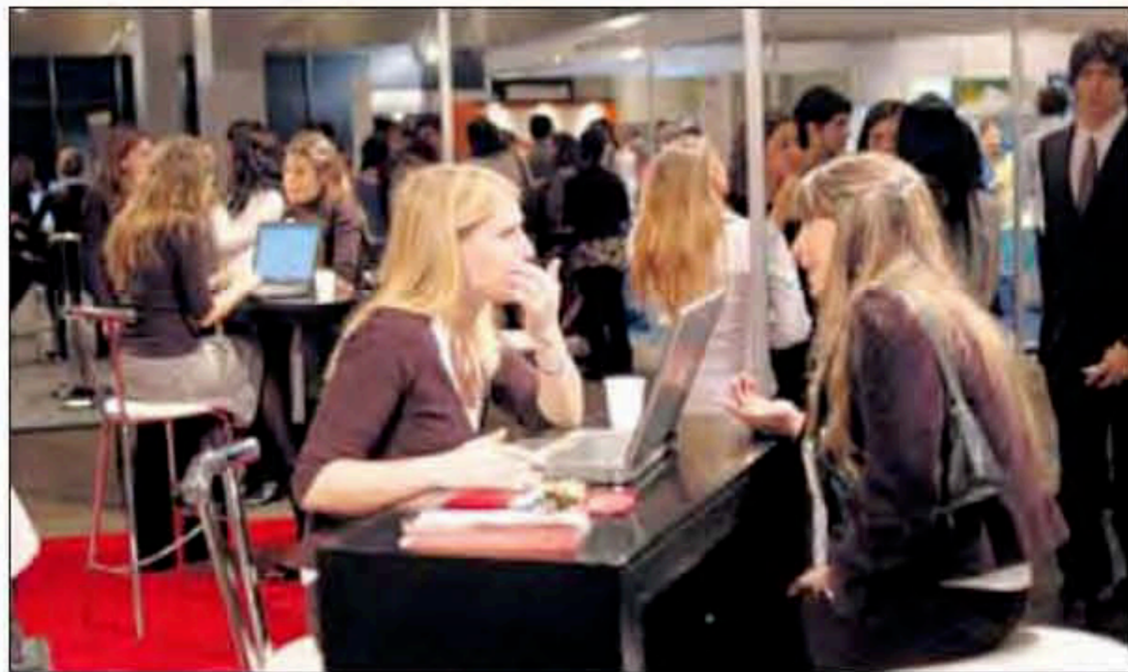
Entrevistas de trabajo, una constante dentro del encuentro