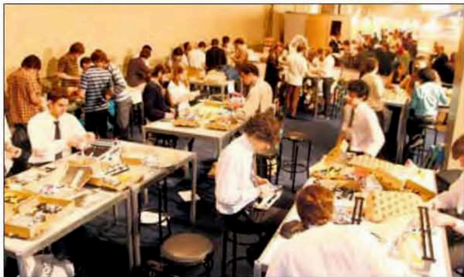
Grupos de ingenieros trabajando en el Desafío Rasti, en Consortium 2007